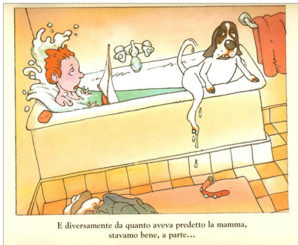
E diversamente da quanto aveva predetto la mamma, stavamo bene, a parte...

come termine unico ( picturebook ). In questo libro le parti verbali e iconiche instaurano tra di loro un continuo gioco di rimandi e richiami, tanto da definire un insieme indivisibile , dove nessuno dei due mezzi espressivi gode di una propria autonomia narrativa (Nikolajeva, 2006). Il rapporto quantitativo tra testo e immagini varia di volta in volta: in alcuni libri la parte verbale è costituita da poche parole o frasi, mentre in altri il testo può essere