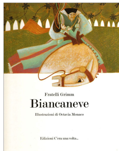
F.lli Grimm (ill. di Monaco O.), Biancaneve, C'era una volta... , Pordenone 1997

Nell' illustrated book (libro illustrato) il testo scritto è preesistente alle immagini , nel senso che è già completo in sé e non ha bisogno della parte iconica per essere compreso (Nikolajeva 1997, 2006). In esso le figure (a volte anche numerose), sebbene subordinate alla parte verbale, apportano un importante contributo interpretativo al racconto (Blezza Picherle, 1996, 2002, 2004a). Si pensi, ad esempio, alle diverse versioni illustrate delle fiabe o di altri classici per l'infanzia 3 (Zipes, 1996).