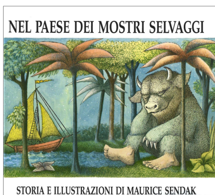
M. Sendak, Nel paese dei mostri selvaggi , Babalibri 1999 (1963)

La situazione è molto più chiara e lineare, anche a livello terminologico, all'estero dove gli studi teorici in questo ambito sono molto sviluppati ed avanzati, ormai da moltissimi anni, a differenza di quanto accade in Italia.